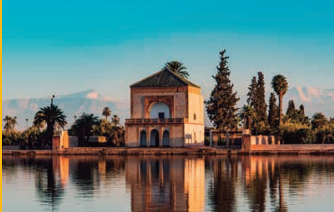
Pabellón Saadiano, Marrakech. MARRUECOS.